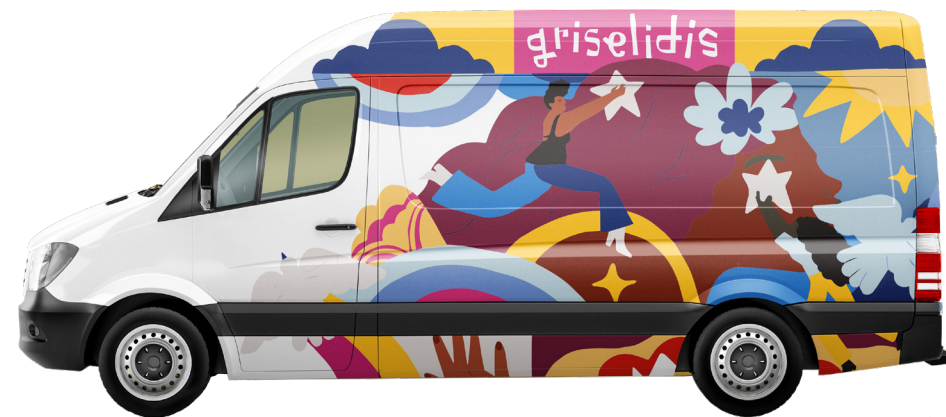
Nouvelle fresque du bus / Neues Bus-Wandgemälde par / von María Chacon

Auf unsere 15 Jahre und weitere Abenteuer!