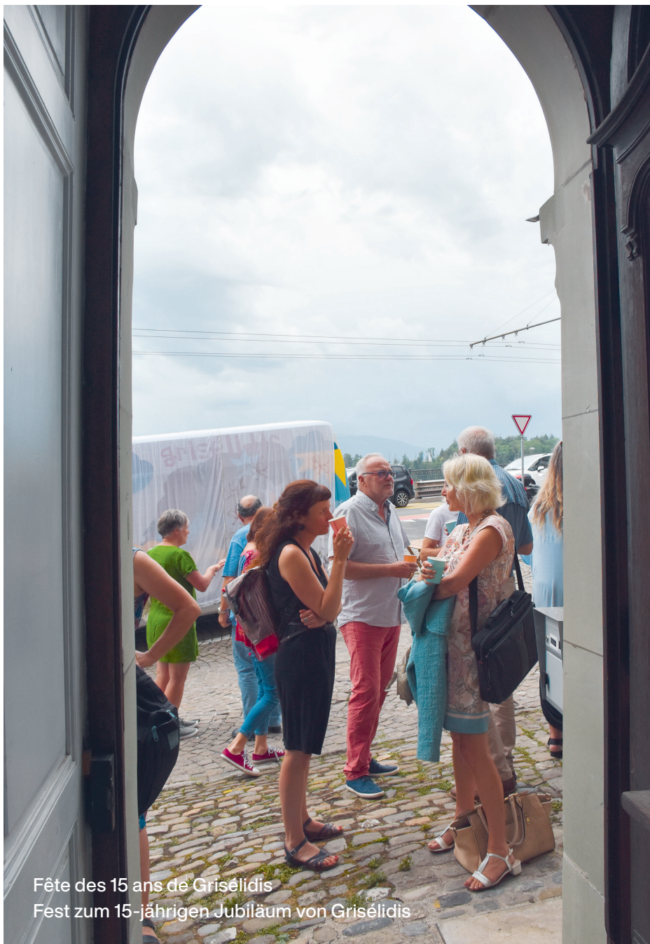
Fête des 15 ans de Grisélidis Fest zum 15-jährigen Jubiläum von Grisélidis