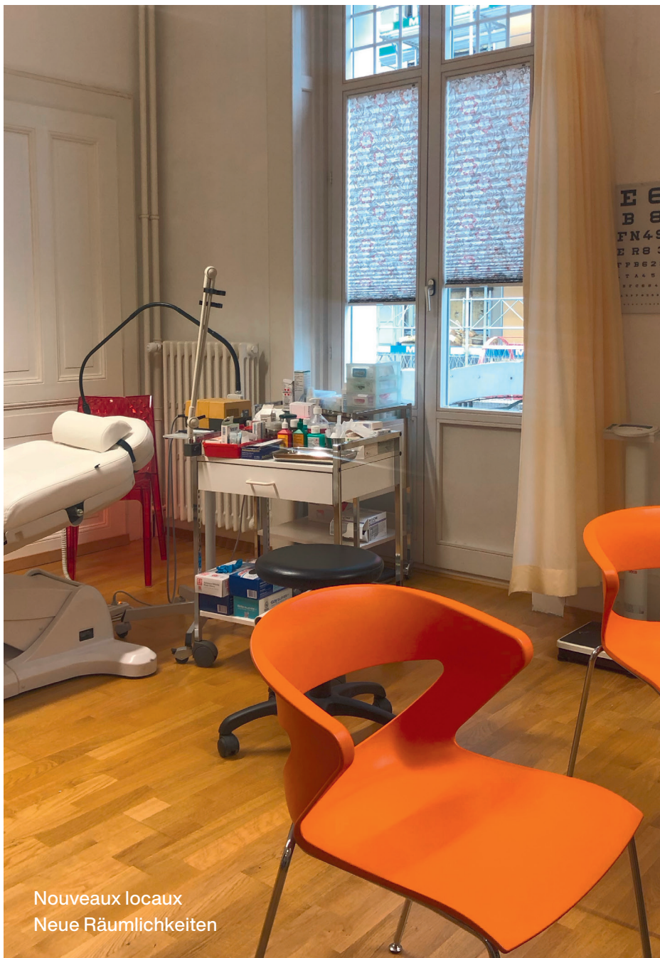
Nouveaux locaux Neue Räumlichkeiten